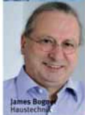
James Bogner Haustechnik