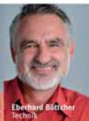
Eberhard Böttcher Technik