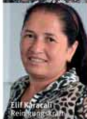
Eilif Khracali Reinigung/SGM

WIR SIND SCHATZ KISTL Seit 12 Jahren. Mit Leib und Seele ... Schatzkistl DAS MUSIK-KABARETT