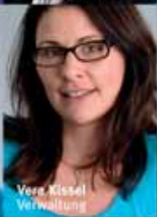
Vera Kiesel Verwaltung